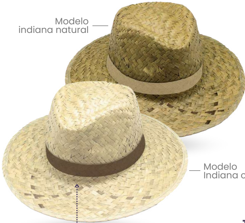
Modelo Indiana claro